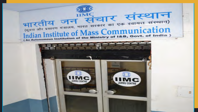
IIMC भारतीय जन संचार संस्थान (सूचना और प्रसारण मंत्रालय, भारत सरकार का एक स्वायत्त संस्थान) Indian Institute of Mass Communication (An Autonomous Institution of the Ministry of I&B, Govt. of India)