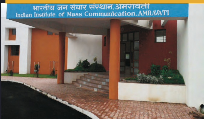
भारतीय जन संचार संस्थान, अमरावती Indian Institute of Mass Communication, AMRAVATI