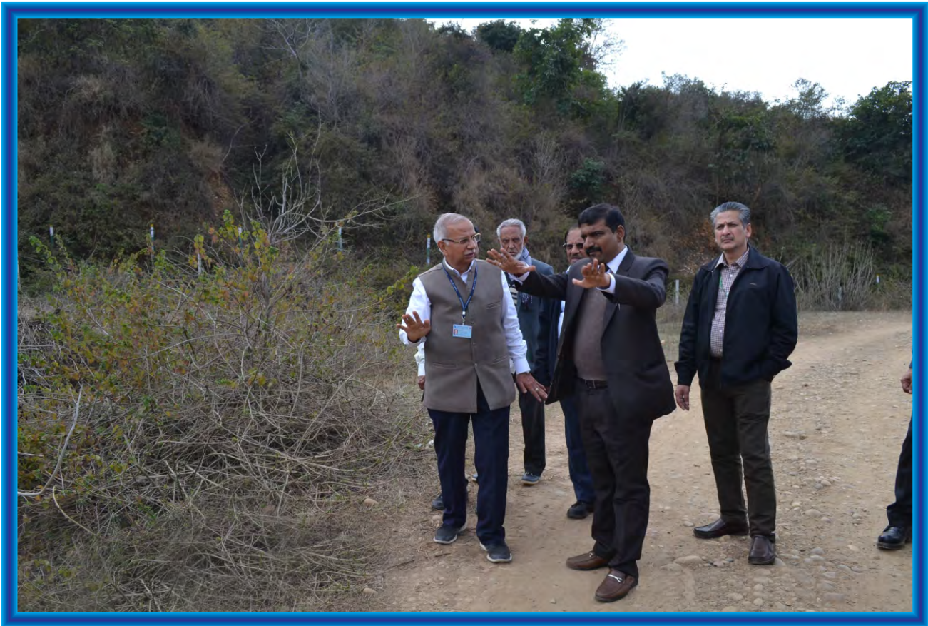
DG, IIMC Shri K G Suresh during inspection of site for a permanent IIMC's Northern Regional Campus, Jammu (J&K)