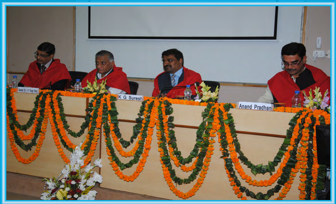
General (Dr) V. K. Singh (Retd), Hon'ble Minister of State for External Affairs graced the Valedictory Function as Chief Guest for the 66 th Batch of Diploma Course in Development Journalism in November 2016