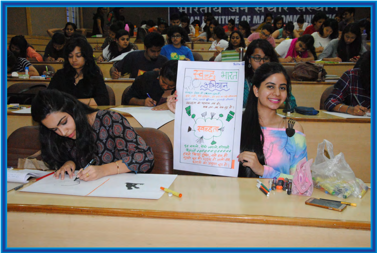
A poster competition was organized on the theme “Swachh Bharat Abhiyan” during Hindi Pakhwara celebrations