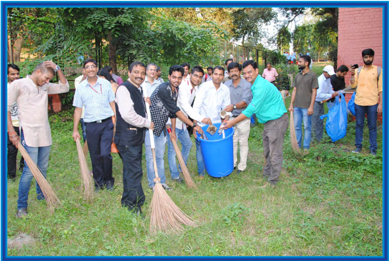
DG IIMC, Faculty, Staff and students actively took part in cleanliness drive during Swachhta Pakhwara