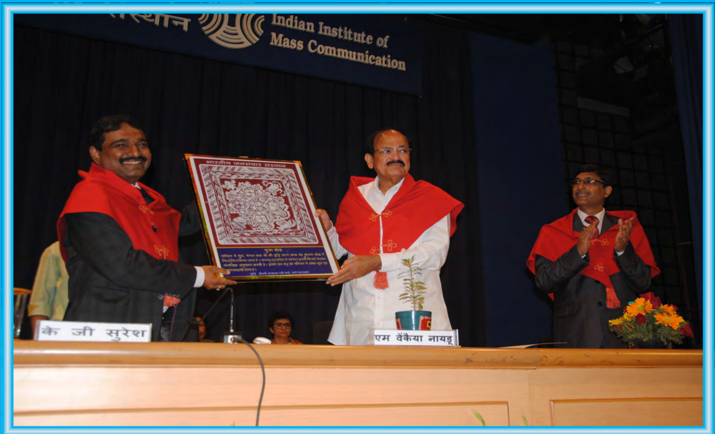
DG IIMC presenting a special memento to the Chief Guest Shri M Venkaiah Naidu, Hon'ble Union Minister for Information and Broadcasting during IIMC 49 th Convocation.