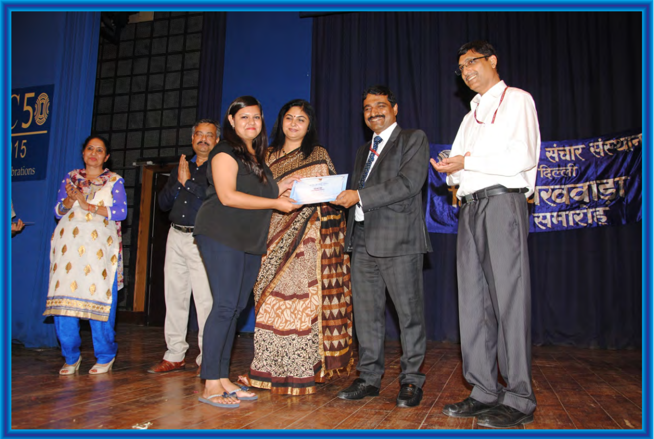
Students getting certificates during Hindi Pakhwara Celebrations