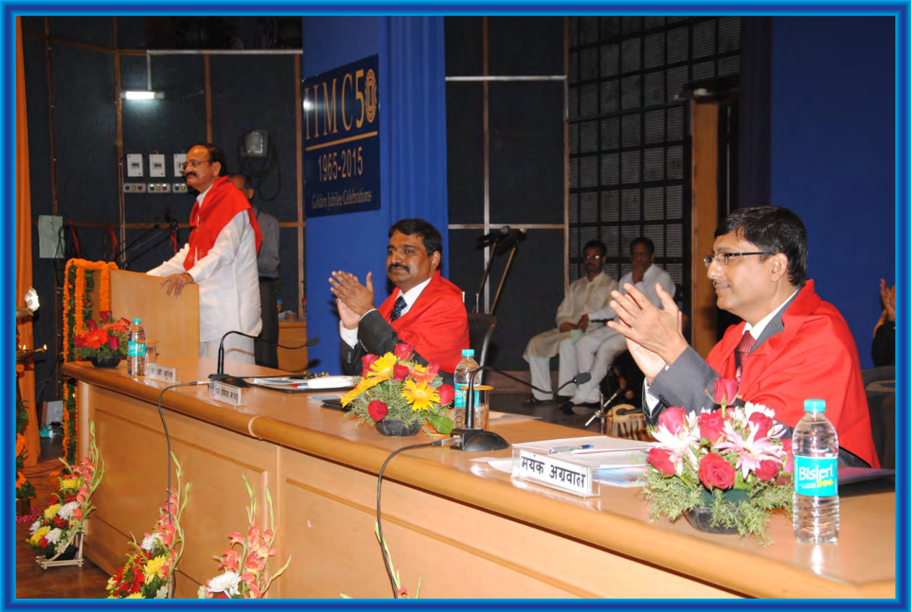
Shri M Venkaiah Naidu, Hon'ble Union Minister for Information and Broadcasting delivering Convocation Address during IIMC 49 th Convocation.