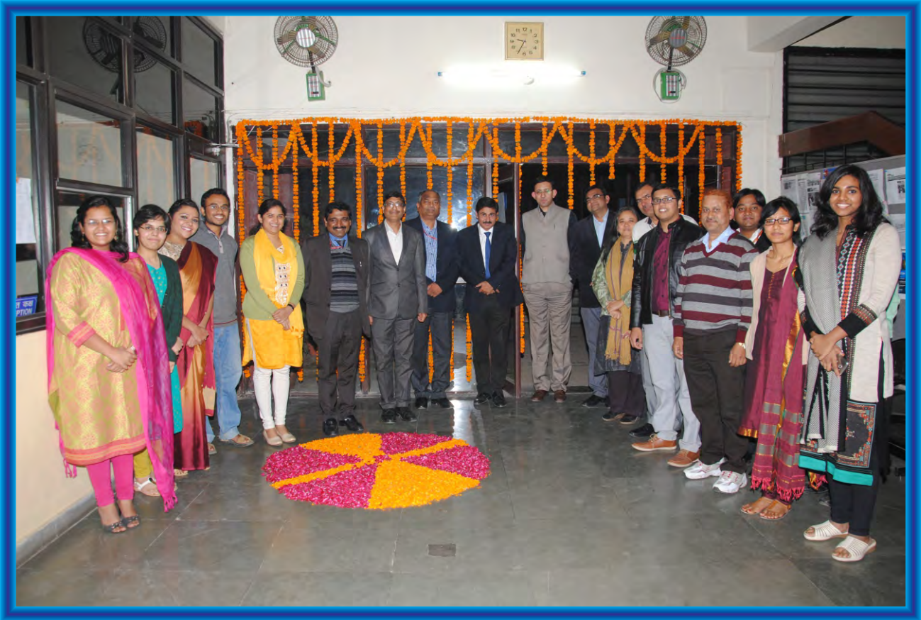
DG, ADG and Senior IIS Officers and Probationers during Diwali Celebrations