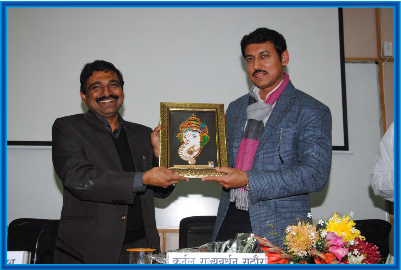
Minister of State for Information & Broadcasting Col Rajyavardhan Rathore (Retd), AVSM was the Chief Guest at a seminar of media educators hosted by IIMC.