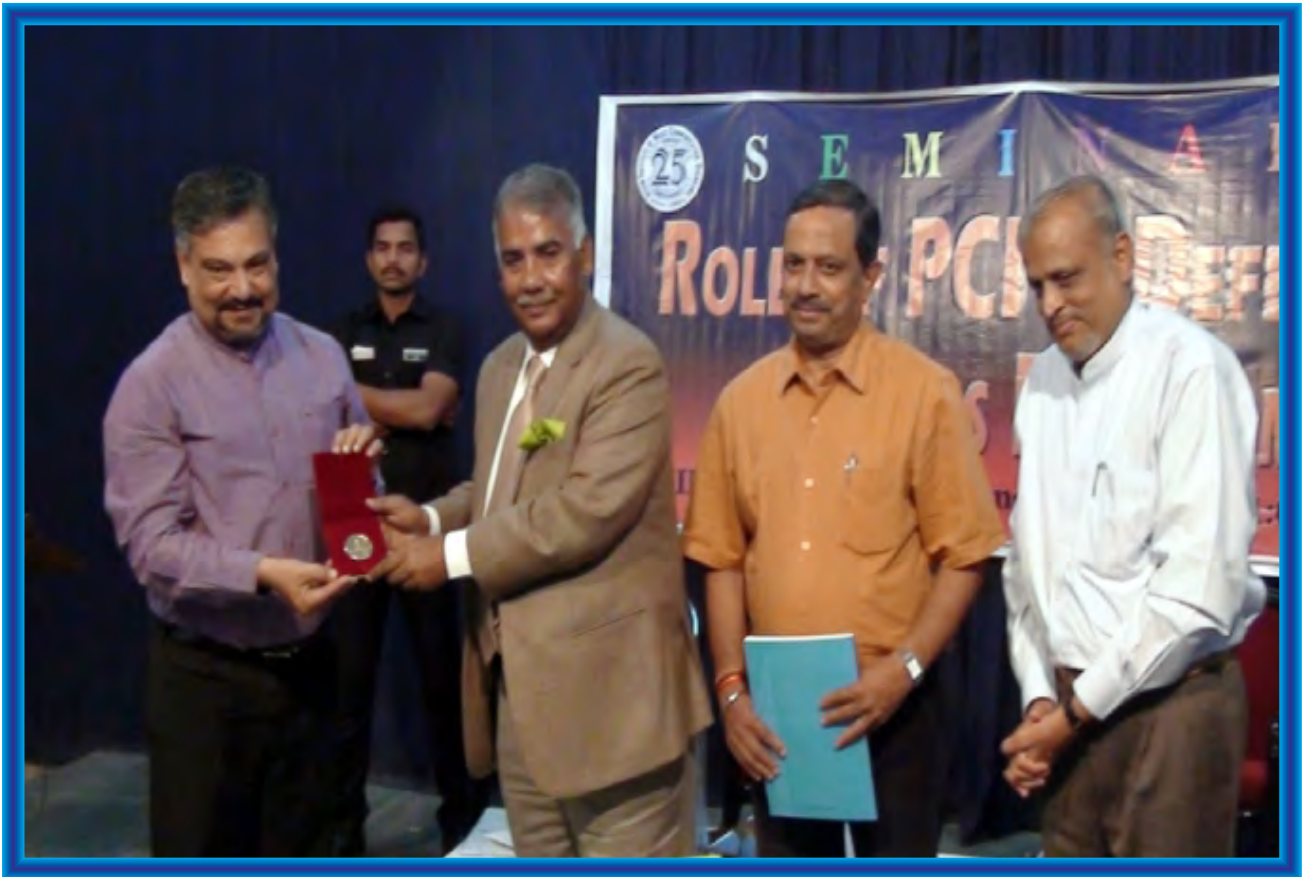
Seminar on “Role of PCI in Defence of Press freedom” in Collaboration with PCI and Odisha Journalist Union organised by the IIMC Eastern Regional Campus on 20 th February, 2017. The seminar was chaired by Justice C K Prasad, Chairman of PCI.