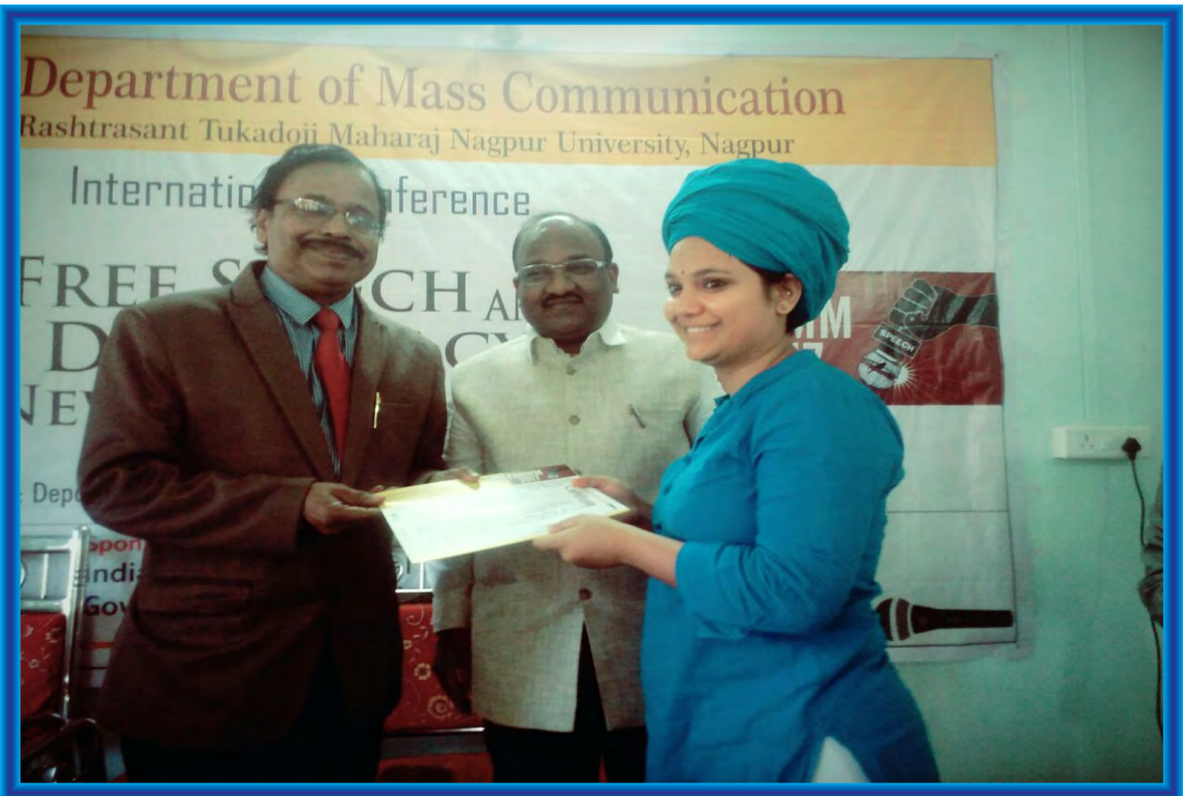
IIMC Western Regional Campus at Amravati, Maharashtra, students participated in the international conference organized by Department of Journalism of SantTukdoji Maharaja Nagpur University, Nagpur on the theme 'New Media and Freedom of Expression'