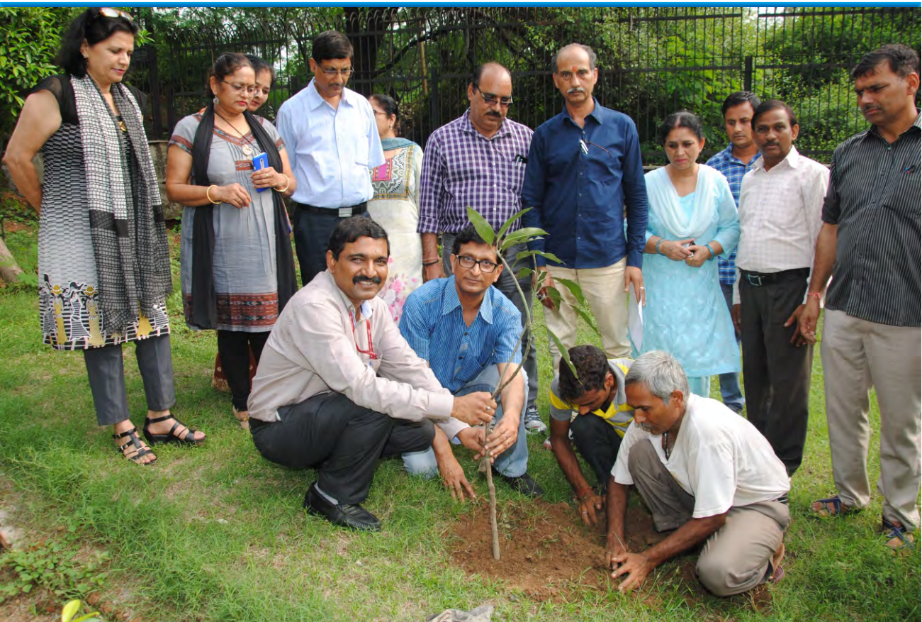
Director General-IIMC and Faculty members during plantation drive at IIMC Delhi in July 2016