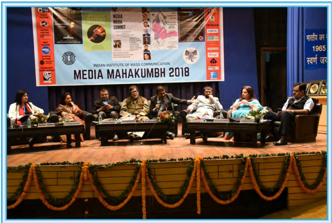
Panel discussion by leading lights of media industry during Media Mahakumbh 2018