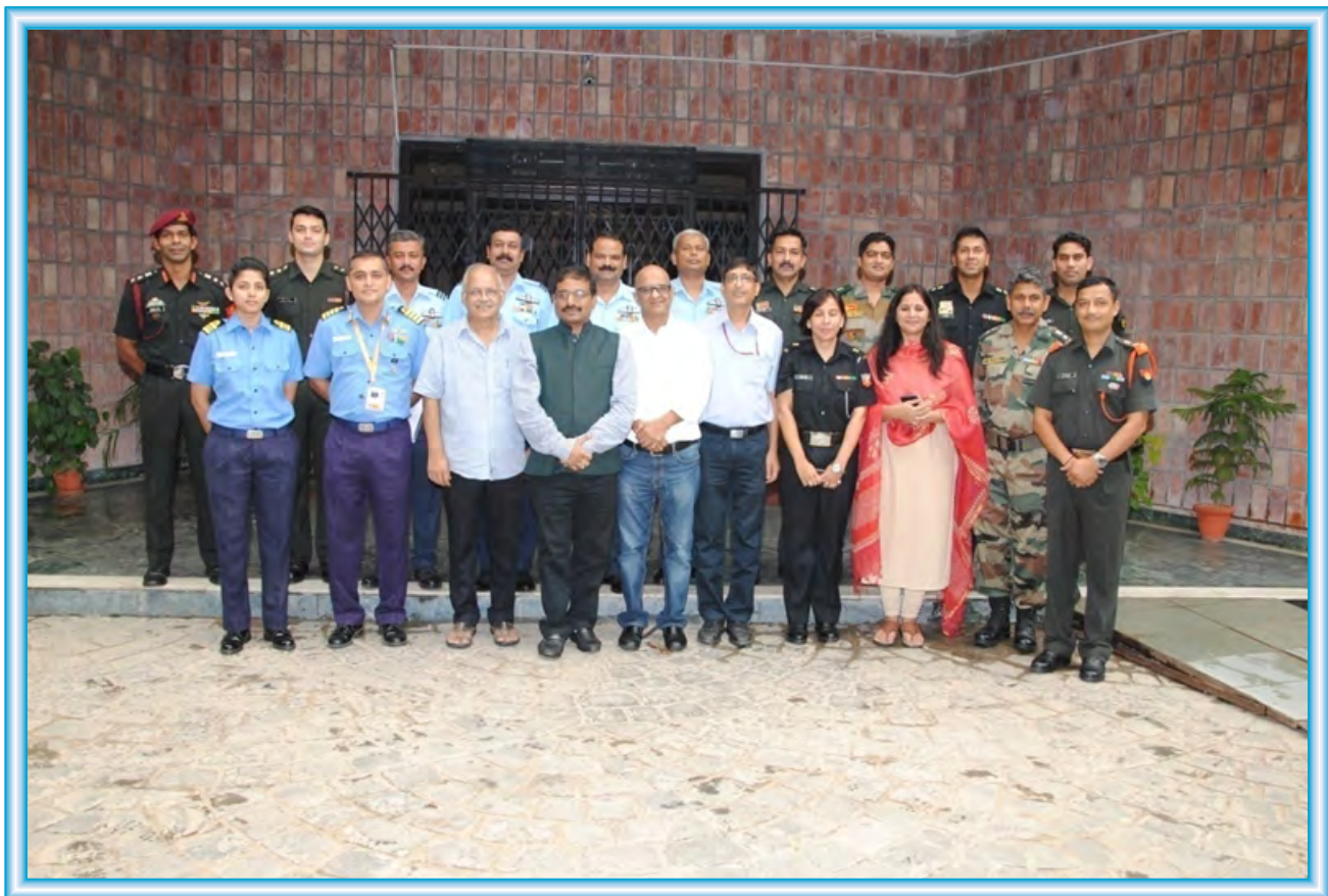
Participants of the Media Communication Course for Officers of the Armed Forces