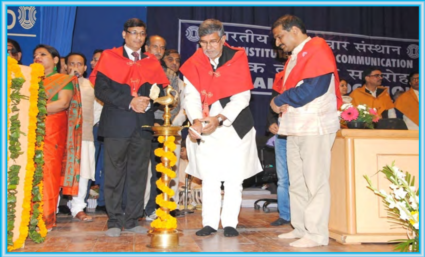
Shri Kailash Satyarthi, Nobel Peace Laureate lighting lamp at the Annual Convocation for the 2016-17 batch.