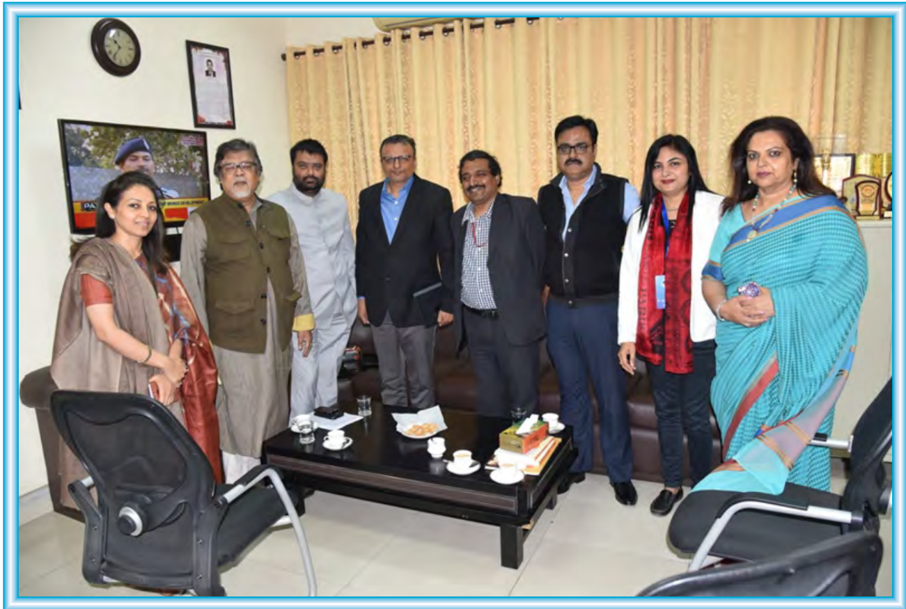
Leading media personalities at the Media Maha Summit held during Media Makakumbh 2018