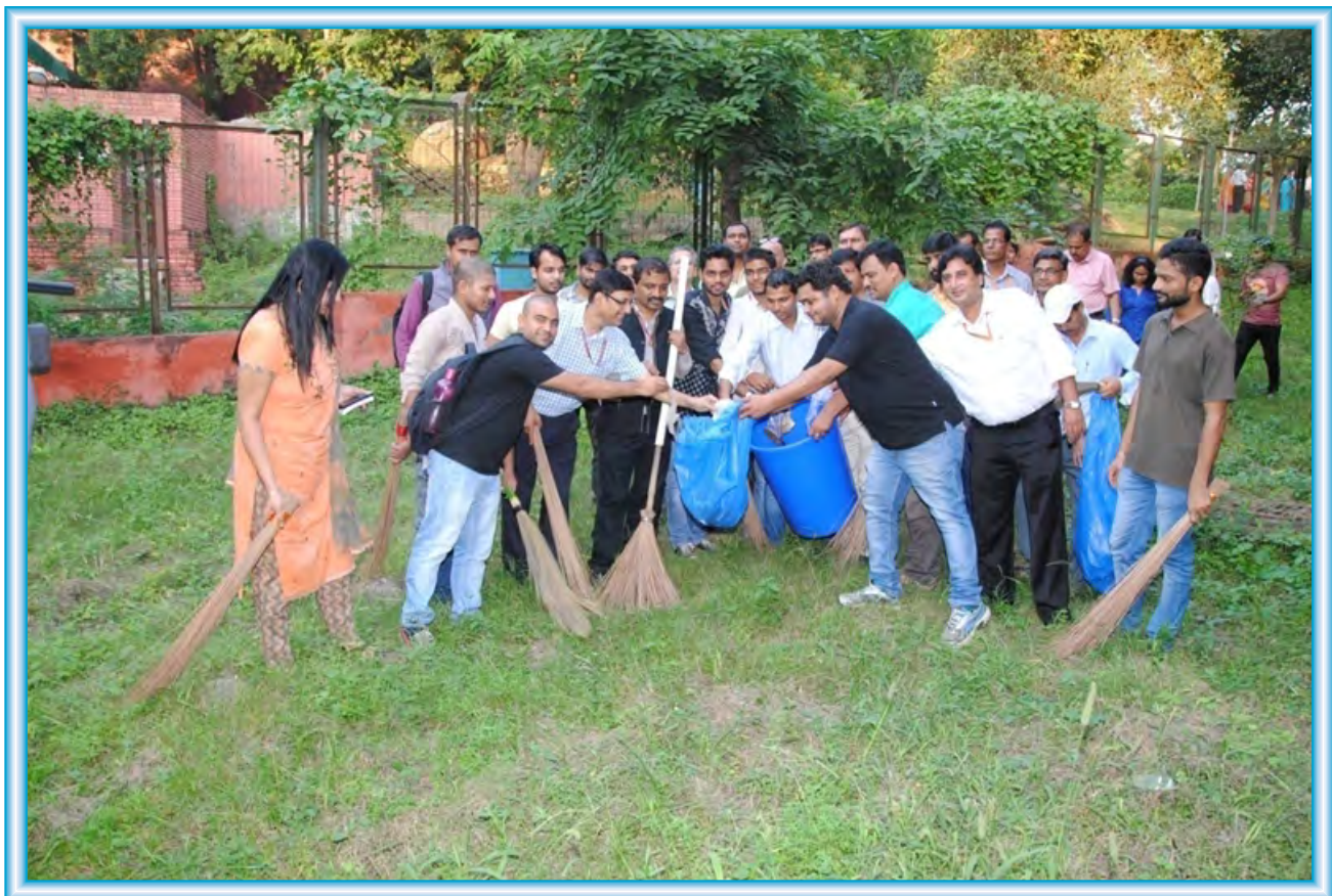
Cleanliness Drive by faculty, students and staff in the Campus as part of Swachch Bharat fortnight.