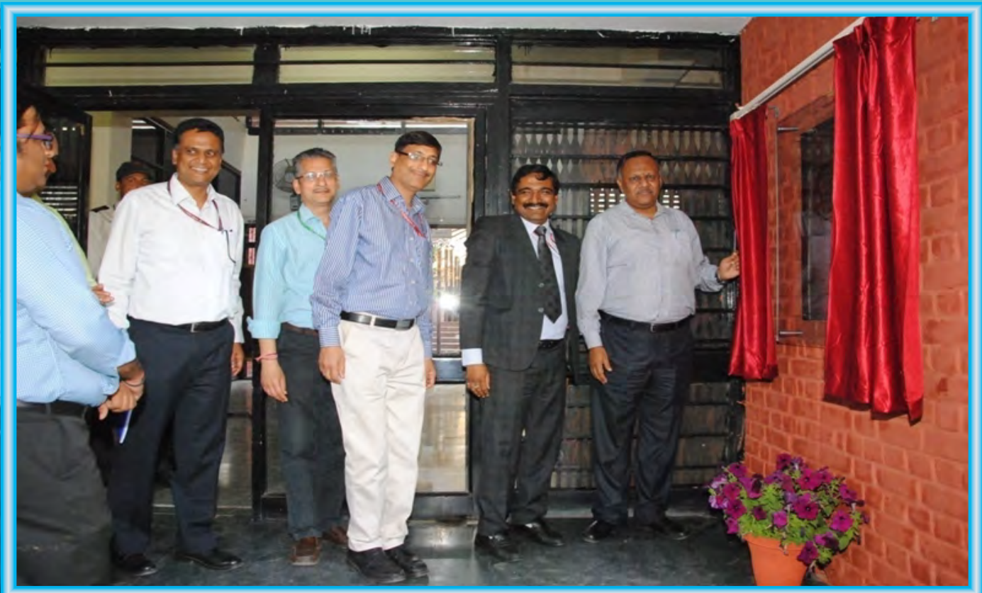
Secretary, I&B & Chairman, IIMC inaugurating 'Community Radio Empowerment & Resource Centre' at New Delhi Campus