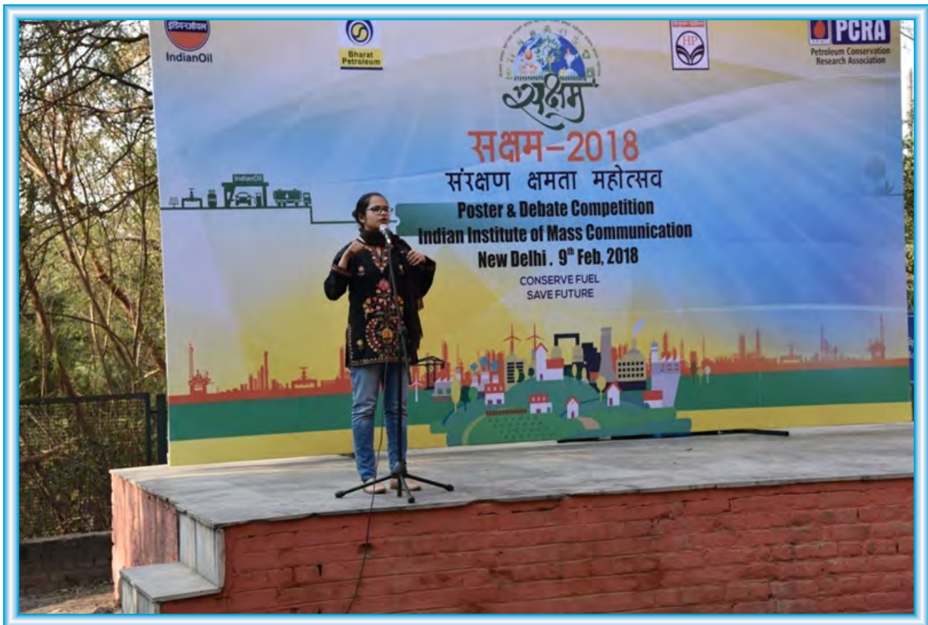
Students participating in the Poster & Debate Competition held on the topic 'Conserve Fuel'