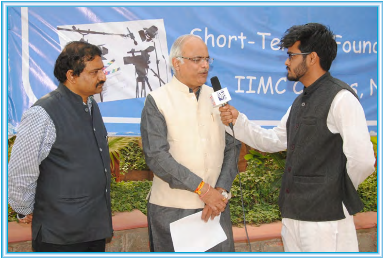
ICCR President Sh Vinay Sahasrabuddhe at the valedictory of the FTII-IIMC Short-Term Foundation Courses.