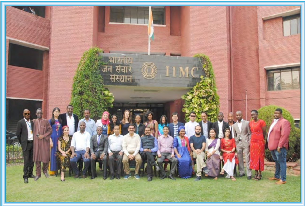
Participants of the 68th Development Journalism Course held from August 2017 to November, 2017