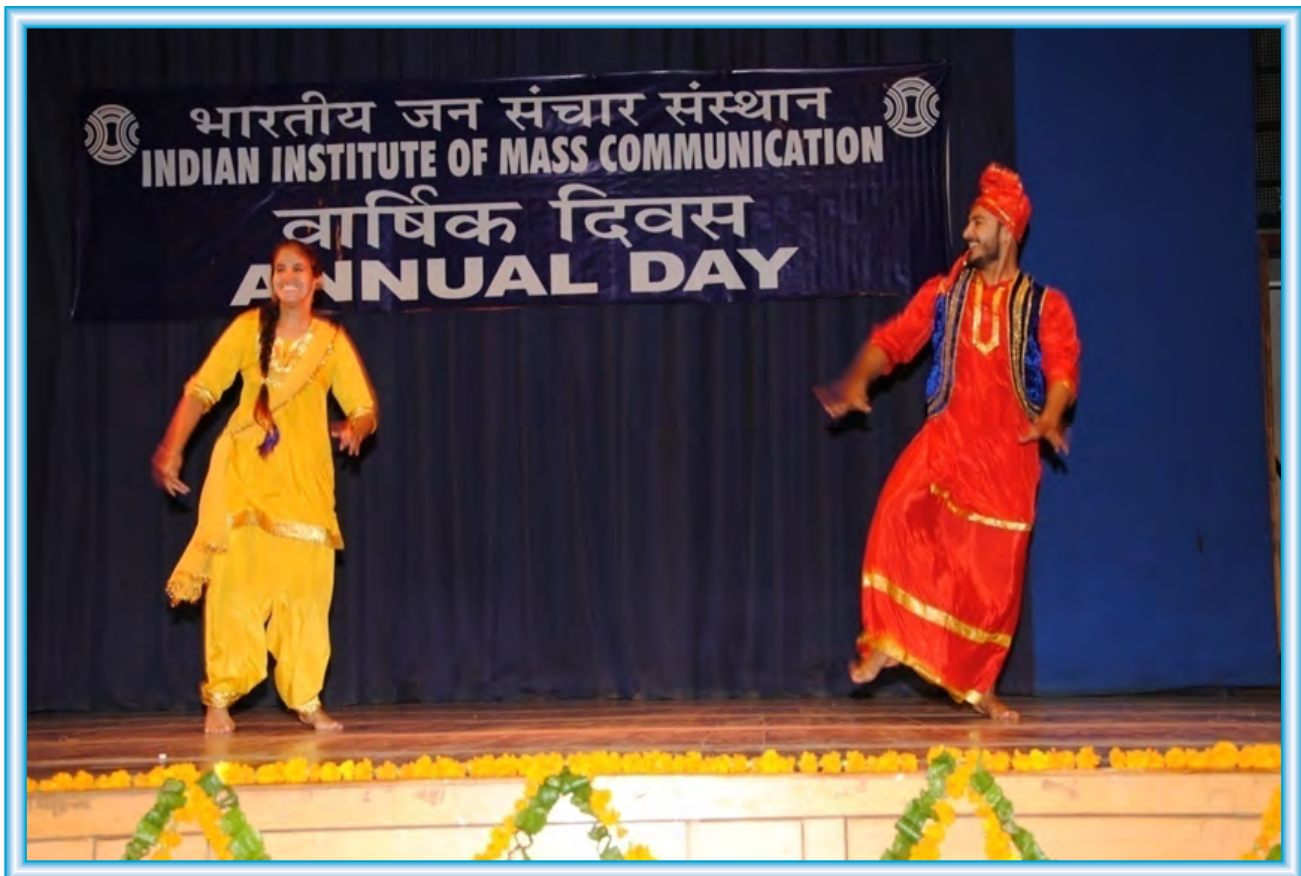
Students celebrating the Annual Day Function 2017.