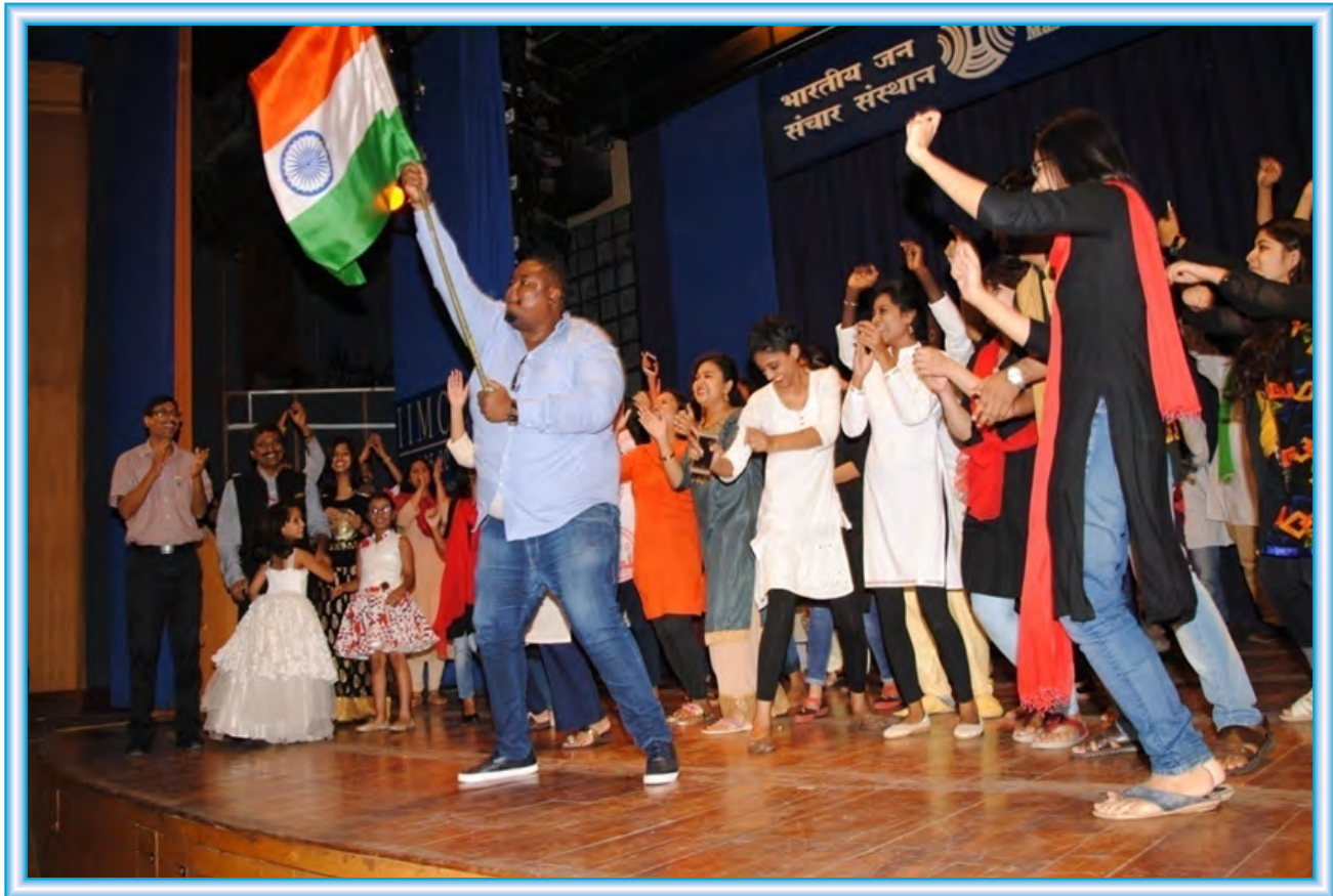
Development Journalism Scholars and PG Diploma students celebrating Independence Day