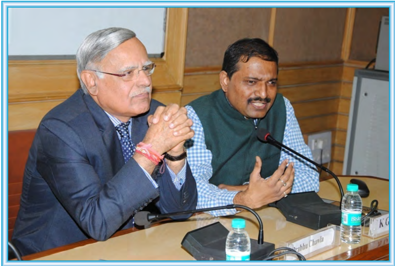
Senior Journalist Sh. Prabhu Chawla addressing officer trainees