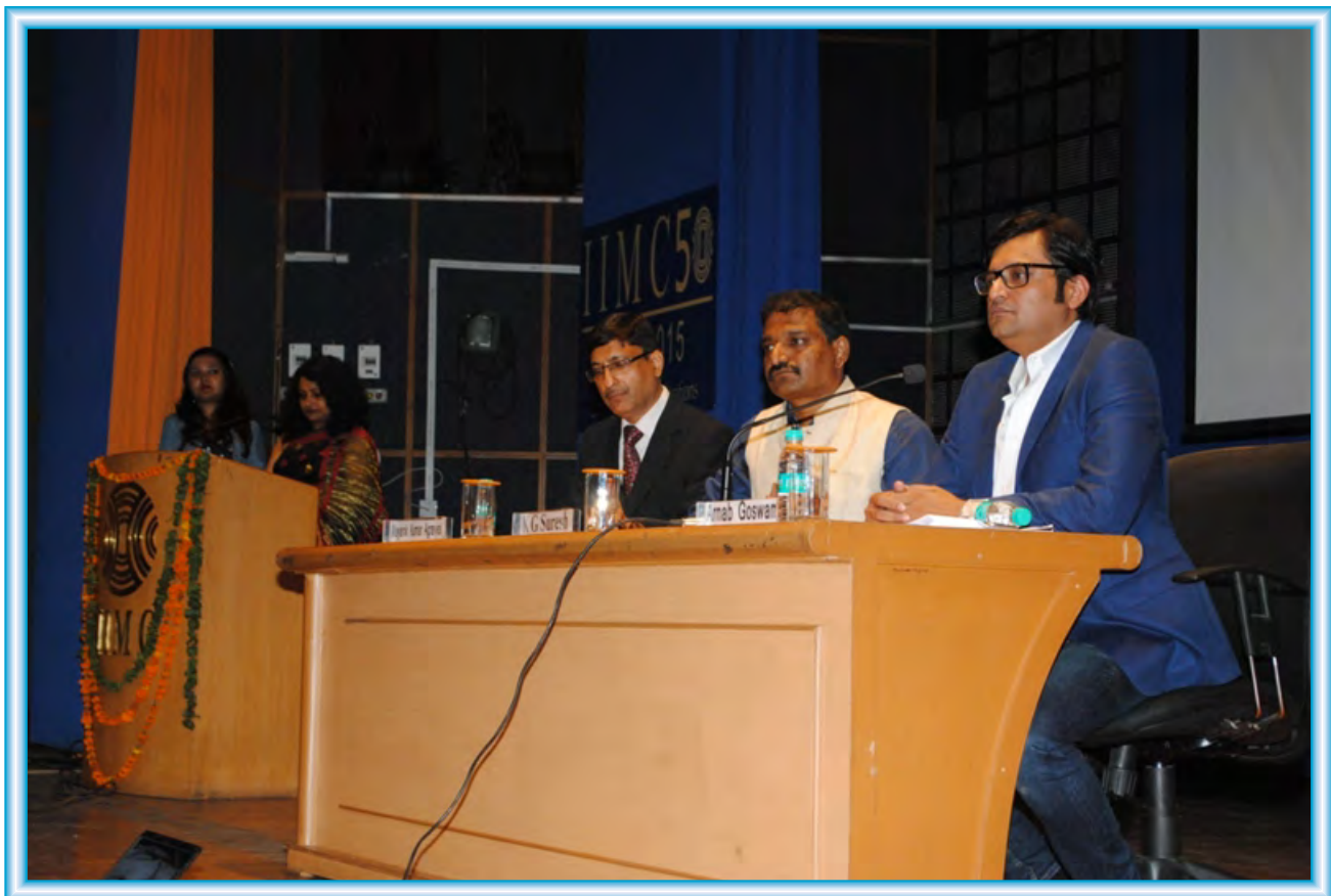
Foundation Day Lecture by Shri Arnab Goswami, Founder and Editor in Chief of Republic TV