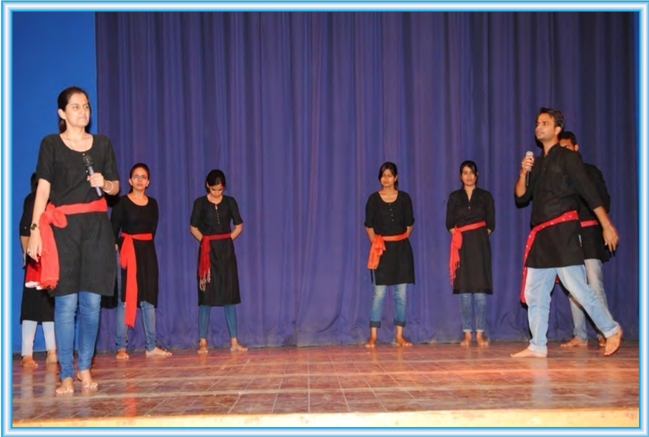
A street play by IIMC students